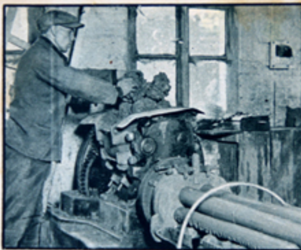
Elke "dikte, die uit den pletmolen komt is voor een andere maat pot bestemd.