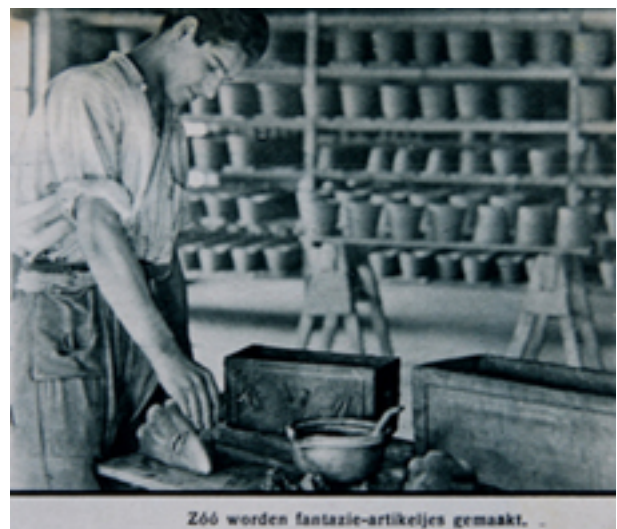
Zóó worden fantasie-artikelijes gemaakt.

maakten de Grieken aarden potten en vazen, waar ze hun wijn in bewaarden. Ook bij opgravingen van oude verdwenen steden kwamen er steeds voorwerpen uit klei vervaardigd aan het licht. Zodat men wel mag zeggen, dat bijna al de oude volken de pottenbakkerskunst beoefenden, waarin dan de Chineezzen zich het eerst bekwaamden en het ook het verste brachten. Immers vonden de Chineezzen het middel om uit een bijzonder soort aarde het fijnste aardewerk te maken : het porcelein. En zulks twee