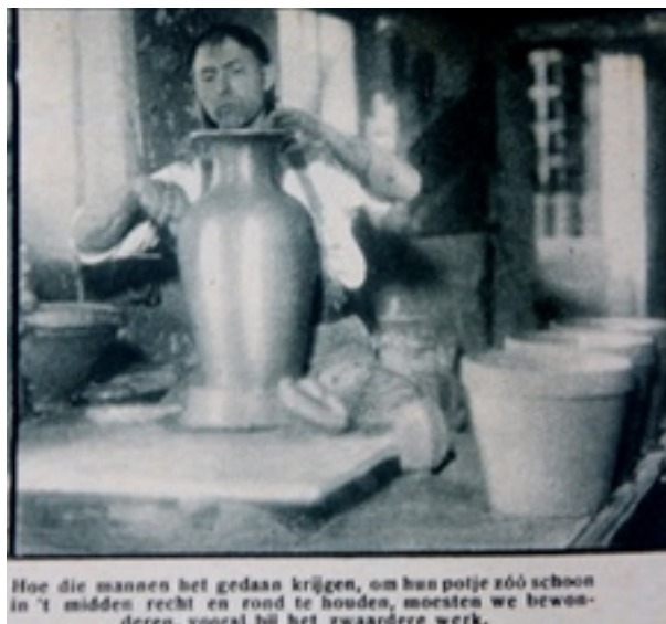
Hoe die mannen het gedaan krijgen, om hun potje zó schoon in 't midden recht en rond te houden, moesten we bewonderen, vooral bij het zwaardere werk.