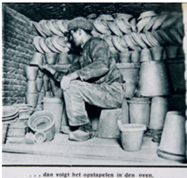
... dan volgt het opstapelen in den oven.

In de beginne werd alles natuurlijk met de hand gemaakt en gevormd. Wanneer de rond-draaiende schijf in voege kwam, is moeilijk te achterhalen. Ze moet echter ook al zeer oud zijn, want de oude Egyptenaren lieten ze door slaven in draaiende beweging houden. Het is dus die schijf of molen die we te zien kregen, maar dan voortbewogen door een motor en voorzien van een rem. Dat uitgezonderd, is het handbedrijf gebleven