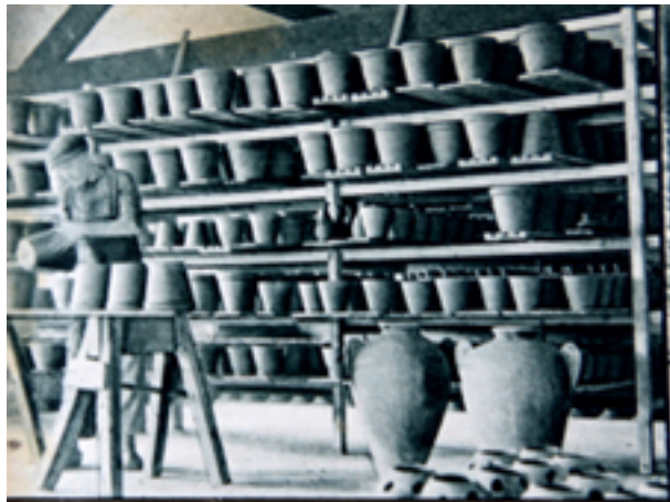
Een blik in de droogkamer waar de gedraaide potten en vazen worden te drogen gezet.