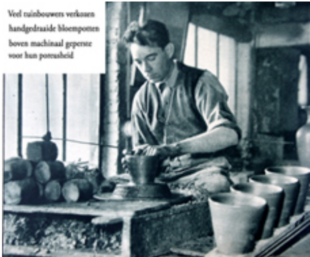
Veel tuinbouwen verkoart handgedraaide bloempotten boven machinaal gepreste voor hun potteusheid

Zijn ze goed droog, dan volgt het opstapelen in de oven, waar men er het vuur onderlegt. Terwijl dan de pottkens aan het bakken