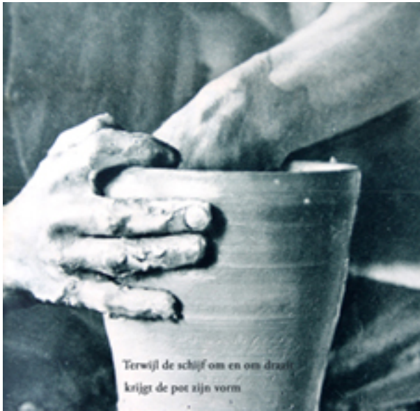
Terwijl de schijf om en om draait krijgt de pot zijn vorm

vonden het handdraaien heel wat belangwekkender dan het machinale. Zie eens hoe die vettige klei zich zet naar de gewenschte vorm, dien de handen van den draaier hem gaan geven. Terwijl de schijf regelmatig om en om wentelt, krijgt de klei den vorm van een pot. Een laatste handgreep, een korte ruk, en het potje is klaar. Hoe eenvoudig toch. Dit zouden we zeker beter kunnen. En we probeerden het ook. Maar we kregen de klei niet rond en we draaiden ellipsen! "Ja 't is allemaal stiel,"