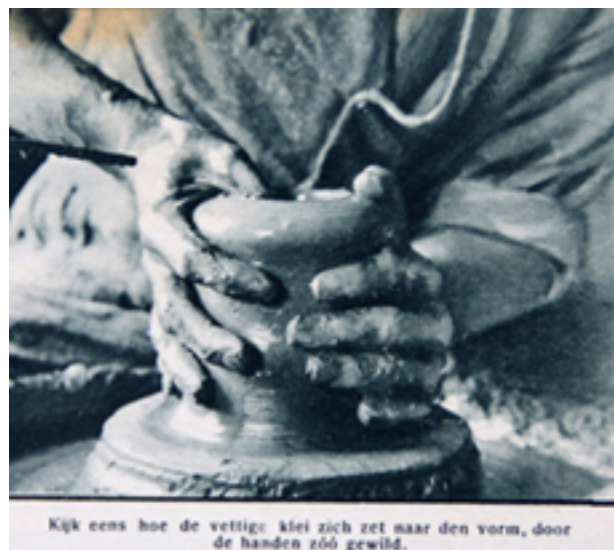
Kijk eens hoe de vettige klei zich zet naar den vorm, door de handen zóó gewild.

We vonden gelukkig nog pottendraaiers, die het oud systeem gebruikten. Want als de potten een zekere afmeting moeten hebben, dan draait men ze toch nog met de hand, op